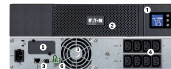
5SC 1500 Rack