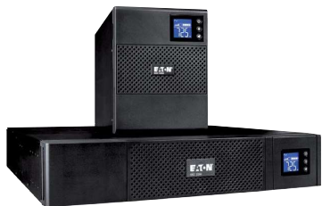
5SC поставляется в удобной компактной конфигурации

Источник бесперебойного питания 500/750/1000/1500/2200/3000 ВА