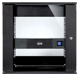
Формат небольшой глубины для установки в компактных стойках